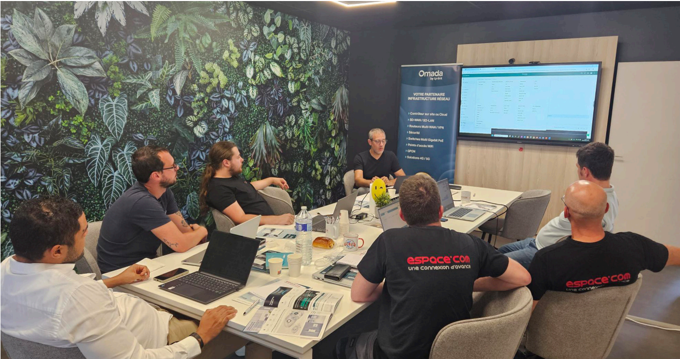
Salle de réunion Espace'Com

Des rencontres régulières autour d'un café pour parler besoins, solutions et projets.