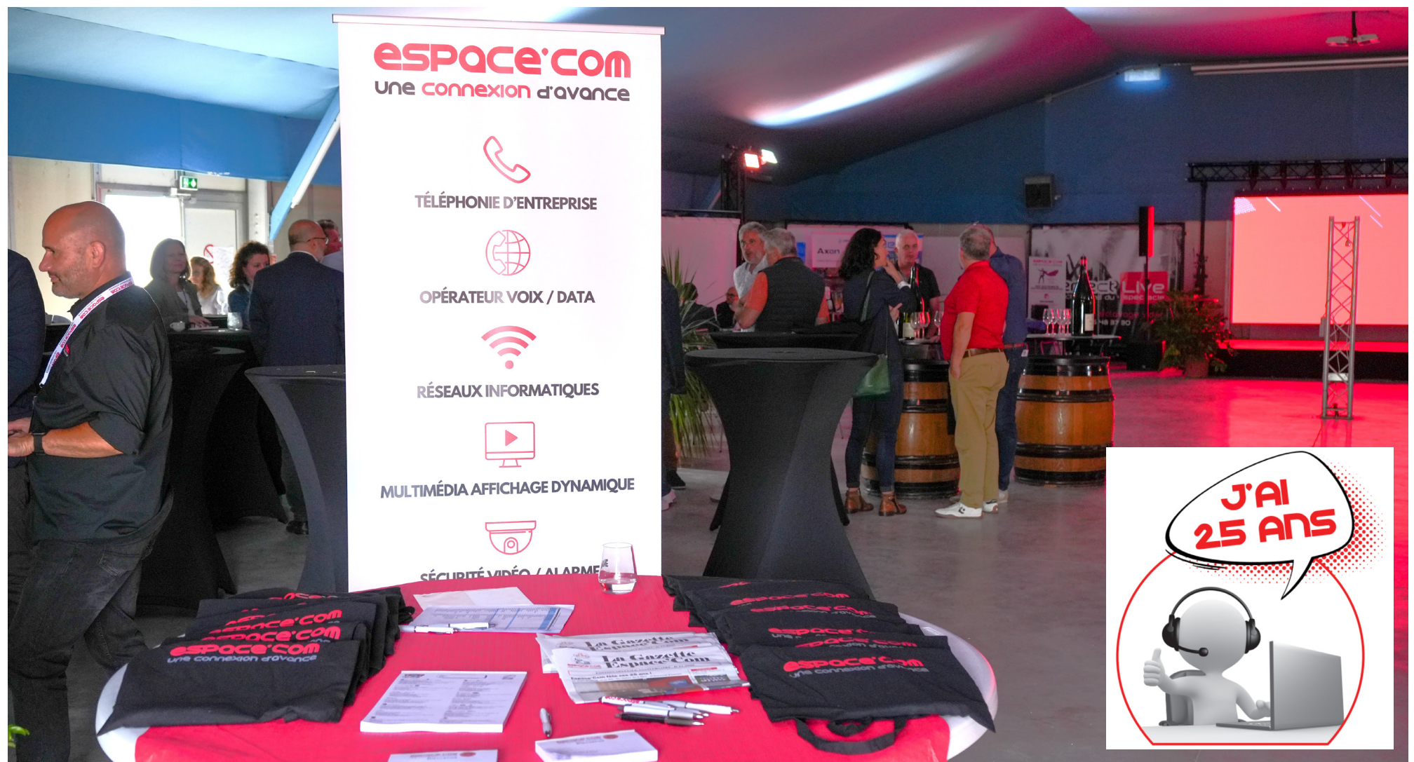
Les 25 ans d'Espace'Com au Réceptif du stade Léo Lagrange à Chalon-sur-Saône

Une journée d'anniversaire marquée par l'échange, la convivialité et des moments forts.